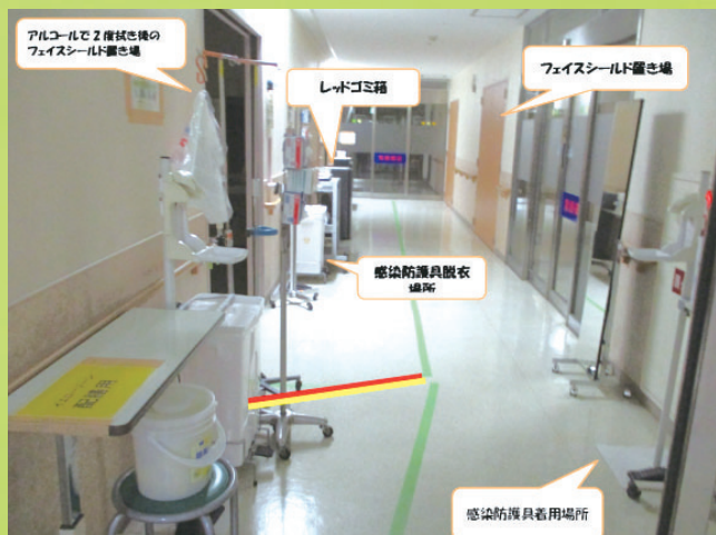
【コロナ受け入れゾーンの様子】

また、スタッフ自身の知識を高めるためにも今後院外研修参加や資格取得を予定しており、将来的には5病棟が患者教育センターのような位置付けになるよう、スタッフ全員で看護力を高めていきます。