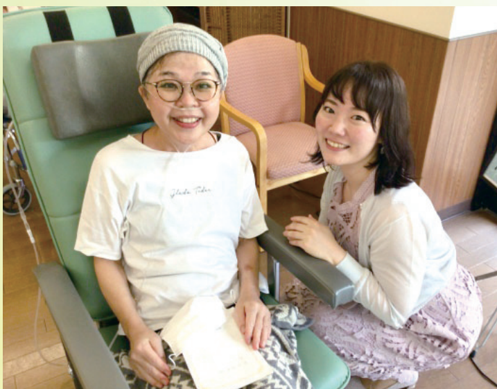
音楽の力で笑顔がたくさん見られました。